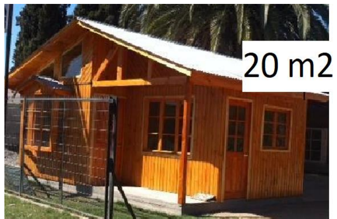
20 m 2 Ventanas según plano